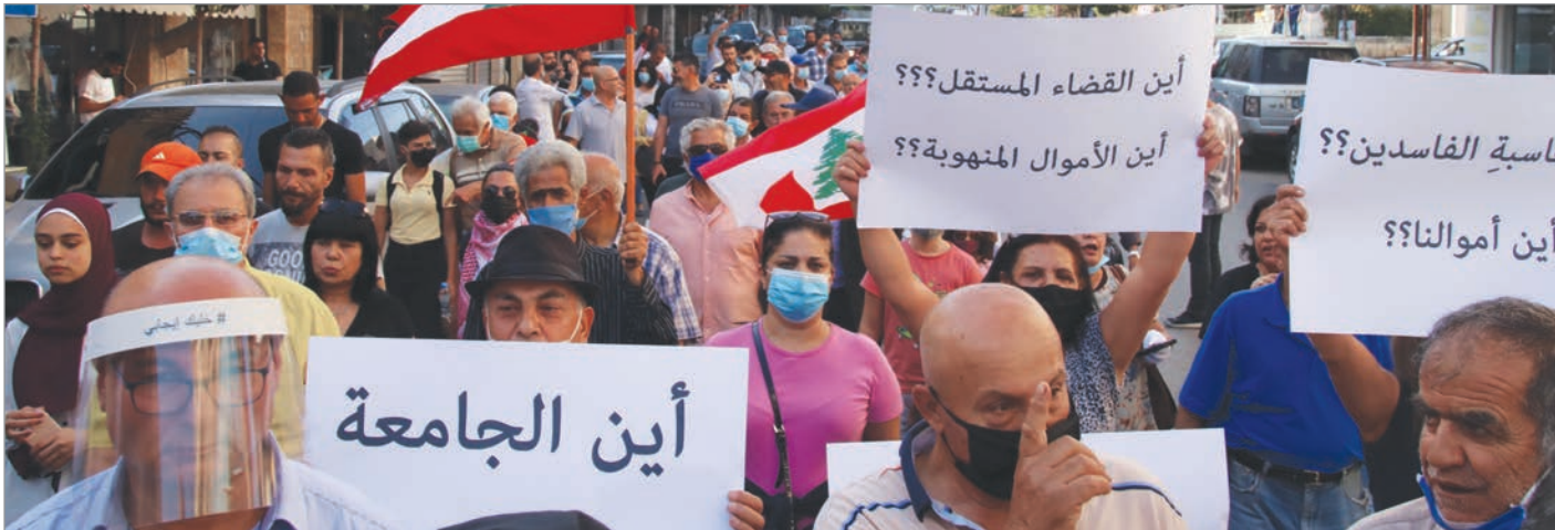
من أبرز الشعارات المرفوعة

يُراد منها تضييع بوصلة المطالب التي جمعت الشعب في 17 تشرين. وفق البعض، هناك شعارات مطروحة ليست بمكانها، لا يُريدون إنتخابات مبكرة، بل يطالبون بقانون إنتخابي خارج القيد الطائفي أولاً، ويرفضون فتح ملفّ سلاح المقاومة لأنه خارج حساباتهم المطالبة. من هنا جاء تحركهم في توقيته الخاص مطلبياً يطرح القضايا المعيشية. ضرب تحرك "حراك النبطية" على وتر