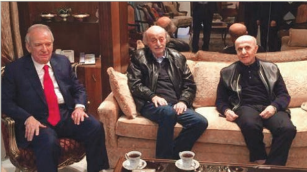
مع وليد جنبلاط ومروان حمادة

اقتضتها الظروف التي تبدلت وتغيّرت بحثاً عن لقاء وطني جديد عابر للإصطفافات القديمة التي كان لها الدور الأبرز في استسهال الحركة الوطنية للحرب الأهلية واعتبارها معبراً ممكناً لتغيير بنية النظام الطائفي. وفي إباحة لبنان للمقاومة الفلسطينية، مما حمّله فوق طاقته وأدى إلى انشطاره شطرين متقاتلين. صحيح أنّ حاوي كان أميناً عاماً للحزب الشيوعي وأنّ ابراهيم كان أميناً عاماً لمنظمة العمل الشيوعي. وصحيح أنّ رفقة "نضال" وعمر جمعت بينهما ولكنهما بقيا في تنظيميهما المستقلّين ولم يتوخّدا. كان يمكن أن يكون ابراهيم رقيقاً لحاوي في الحزب الذي تأسّس في بدايات القرن العشرين ولكنه اختار أن يؤسّس تنظيماً آخر يعتبر أنّه أكثر قدرة فيه على الحركة والعمل بدل أن يكون إطاره تنظيمياً جامداً أو متحجراً. تلك كانت ميزة لبنان الذي انشطر إلى شطرين ولا يزال يعاني من أمراض وأعراض انشطارات جديدة أخطر. بقي الحزب أوسع من المنظمة ولكنّ حاوي مع ابراهيم بقيا أكثر من مجرد رفيقين في تنظيمين.