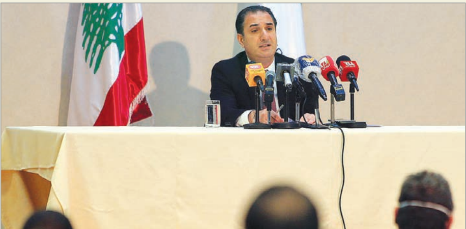
استبعاد "الأسماء الفاقعة" من رئاسة مجلس الإدارة (الوطنية للإعلام)