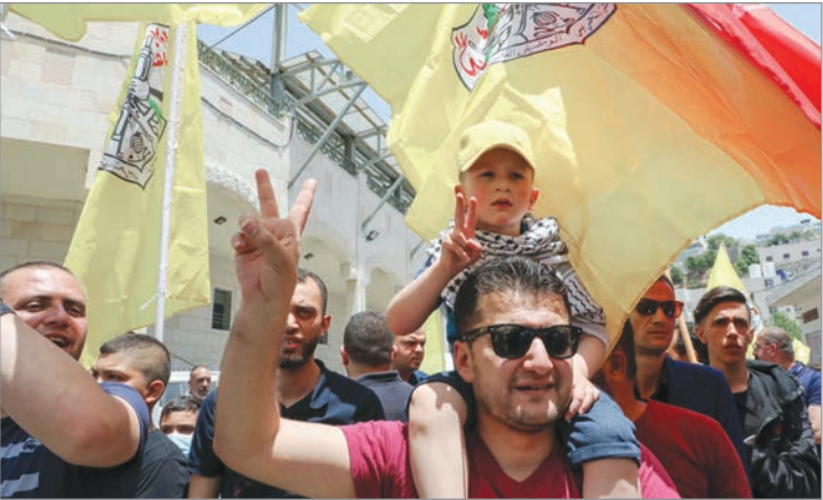
جانب من تظاهرة لحركة "فتح" في الخليل أمس

وتعهّد رئيس الوزراء الإسرائيلي بنيامين نتنياهو بضمّ المستوطنات وأجزاء من الضفة الغربيّة، بينها غور الأردن، وسيقدّم اعتباراً من الأوّل من تموز استراتيجيةً لتنفيذ ذلك. وخلال العقد الأخير، ازداد عدد سكّان المستوطنات المقامة في الضفة الغربيّة بنسبة خمسين في المئة، وبات يعيش فيها حوالي 450 ألف شخص، إلى جانب 2.7 مليون فلسطيني.