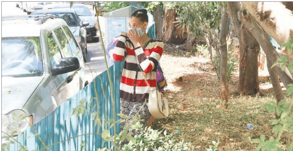
مسلسل التشرّد لم ينته