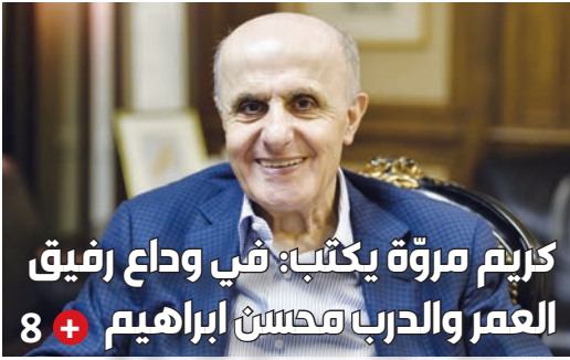
كريم مروّة يكتب: في وداع رفيق العمر والحرب وكسب ابراهيم + 8