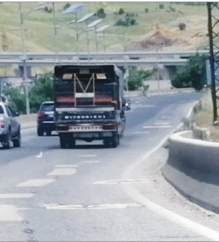
الطريق مصيدة للأرواح والأعطال

ويُكرّر البسط مناشدته وزارة الاشغال لأنّ تعمل على ترفيت الطريق بأسرع وقت، "فكلّما سارعت بتأهيله كلّما انقذت أرواح لبنانيين يُقتلون