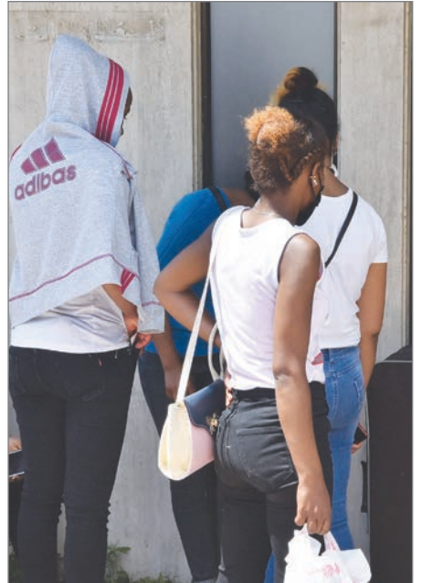
تخلّى عنهنّ أصحاب أعمالهنّ