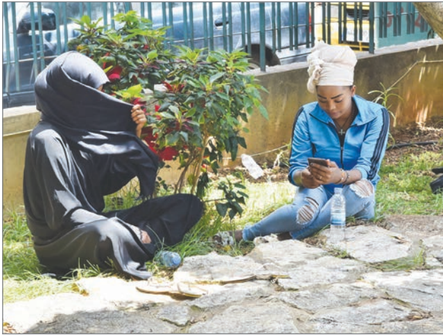
على رصيف الذلّ

"إن تجربتي في لبنان متعبة جداً إذ أنني كما كثيرات قد تعرضت لانتهاك حقوقي كإنسان، ولإساءات جنسية ونفسية وجسدية وأخيراً