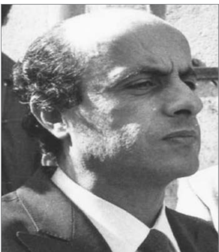
رمز سياسي تاريخي

كانت إذاً تلك البداية الصعبة شخصياً وحزبياً مع محسن ورفاقه. لكنّ المرحلة التي اقترنت بتشكيل "الحركة الوطنية"، أحدثت تغييراً جوهرياً في العلاقة بين حزبينا، بقيادته هو لحزبه، وقيادة جورج حاوي لحزبنا. وامتدت تلك العلاقة بالاتجاه الصحيح داخل "الحركة الوطنية" بقيادة كمال جنبلاط، لم تتأخّر في الإتفاق على تعيين محسن الأمين العام التنفيذي للحركة الوطنية. وكان جورج إلى جانب محسن في العلاقة الوطيدة الإستثنائية مع كمال جنبلاط حتى استشهاده في العام 1978، كانوا يمارسون دورهم في المعارك المتعددة، السياسية منها والمسلّحة، لا سيما مع الثورة الفلسطينية بقيادة ياسر عرفات. منذ ذلك التاريخ، بدأت العلاقة بين حزبينا مع بداية الحرب الأهلية في الاتجاه الذي كان يرمي إلى تحقيق الوحدة المتكاملة بين حزبينا، تحقيقاً لما كان يطمح إليه محسن قبل عقدين من الزمن. وأشهد من معرفتي الممتدة خلال نصف قرن مع محسن، بأنه كان شخصية فذة ومرموقة. وكان يتمتع بقدرة استثنائية على الحديث في الإعلام وفي المناسبات المختلفة، للتعبير عن مواقفه الفكرية والسياسية. وكان لجورج حاوي طريقته الفذة في التعبير عن مواقفه، وكاننا بهذا المعنى يتكاملان. في الحرب الأهلية، كنا باسم "الحركة الوطنية"،