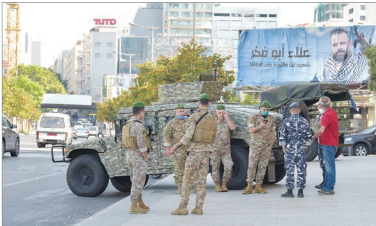
إجراءات أمنية في الساحة استعداداً لتحركات اليوم