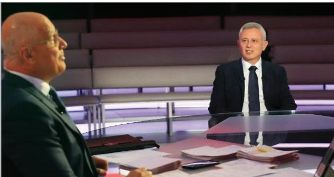
خريطة الأعداء لأي مرشح أوضح من خريطة حلفائه (موقع المردة)

غير أن الأهم في حديث فرنجية والذي يمكن البناء عليه لفهم بعض ما يدور على الساحة السياسية هو الحديث عن الانتخابات الرئاسية، والتي يبدو أن معركتها فتحت باكراً. رداً على سؤال عن الأمر، قال فرنجية إنه وباسيل مرشحان من فريق "8 آذار"، لكنه أكد بالمقابل: "لن نقبل برئيس جمهورية من خارج فريقنا السياسي ويرتكز على خلافاتنا"، وهذا ما يمكن أن يفهم على أن أي مرشح هو رهن كلمة سر قد تصبّ في لحظة