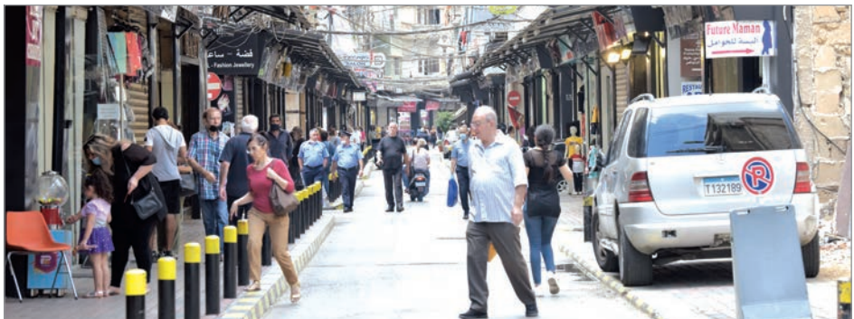
سيغرض "قيصر" على التجار والممولين والمستثمرين حسم خياراتهم بالتعامل مع الشرق أو الغرب (رمزي الحاج)

التعارض مع القانون، من نتائج على الافراد والمؤسسات، وبالتالي على الاقتصاد. فحول تحسم الحكومة الخيار أم تستمر بوضعه في المنطقة الرمادية تحت ستار دور لبنان في إعادة إعمار سوريا، وبالتالي الالتفاف على القوانين الدولية وكشف لبنان على نار الصراعات الإقليمية "النيرونية"؟.