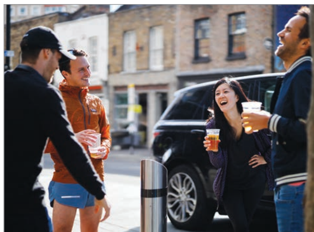
رؤاد الحانات يشربون البيرة في الهواء الطلق في لندن أمس

توازياً، تجاوزت المملكة المتحدة عتبة 40 ألف وفاة لمرضى تأكدت إصابتهم بالفيروس القاتل، في حين أظهرت دراسة أن انتشار الوباء بصدد التسارع، ما يثير مخاوف في وقت يُحاول البلد رفع الحجر تدريجياً. وسجّلت 40261 وفاة حتى الخميس، بزيادة 357 وفاة جديدة خلال 24 ساعة، وبلغ إجمالي الإصابات 283311، وفق أرقام وزارة الصحة. وهذه ثاني أعلى حصيلة في العالم بعد الولايات المتحدة، لكن أظهرت دراسات عدّة أن بريطانيا سجّلت معدل الوفيات الأعلى في العالم مقارنةً بعدد السكّان. 19