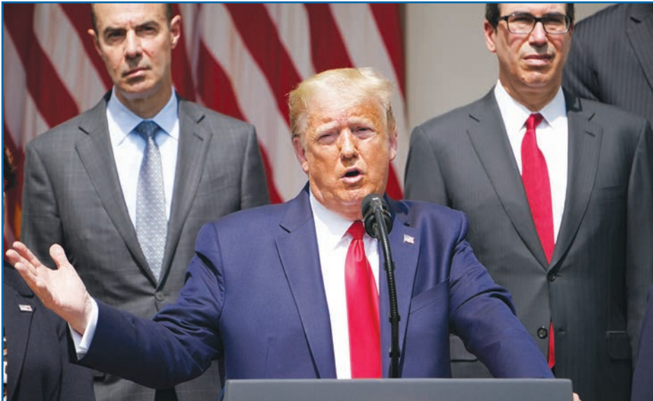
ترامب يُراهن على التعافي الاقتصادي السريع للتجديد لولاية رئاسيّة ثانية