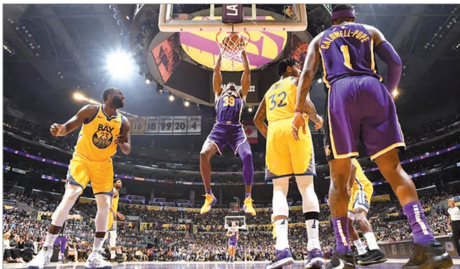
من مباراة لايكرز - ووريورز قبل توقف البطولة