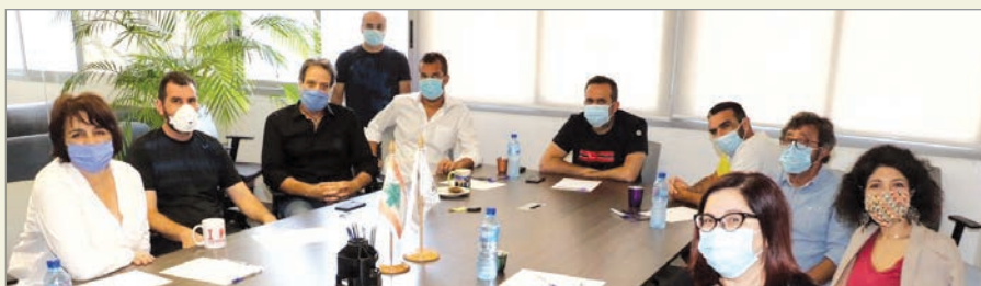
فيصل مترساً إجتماع الإتحاد

لحافة الفئات العمرية في حال سحنت الظروف الصحية المتعلقة بانحسار وزوال وباء "كورونا" بعد التشاور مع الاندية، وذلك بعد إعادة الفتح الكامل للحركة بقرار من السلطات الرسمية، في اطار خطة إعادة الحياة بصورة طبيعية الى اللعبة وتفعيلها وإعادتها الى ما وصلت اليه من نجاحات في السنوات الأخيرة. - الموافقة على إنضمام نادي لامارينا (ضبية) ونادي قمر الدين الرياضي (طرابلس) الى عائلة الاتحاد.