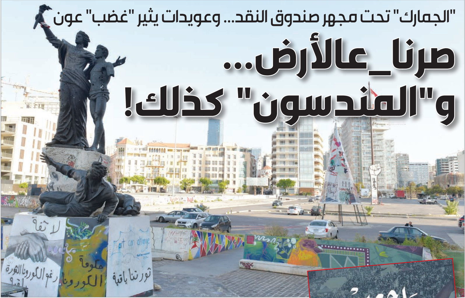
العين على ساحة الشهداء اليوم (رمزي الحاج)

من رهاب المشهد قبل حدوثه خوفاً من أن يشكل منصة إشعال لفتيل انفجار اجتماعي يتحدى سطوتها ويقوّض سلطتها، فعاد الرهان بشكل واضح على سلاح "المندسين" لخرق صفوف المجموعات الثورية والتشويش على أهداف تحركها على الأرض، سيّما وأنّ العديد من "ثوار تشرين" لمسوا تسلل دخلاء إلى جبهتهم لضعفة ركانزها وحرف معركتها مع المظلمة السياسية، نحو تصادم داخلي في ما بين المكونات الثورية... وإن لم ينفج "مندسو" الداخل في كسر شوكة الشارع، ولم يفلح التهريب الأمني في تدجين التظاهرات وتطويقها، فإن الأحزاب الموالية جاهزة لإعادة استئناف معادلة "الشارع والشارع المضاد"! 19