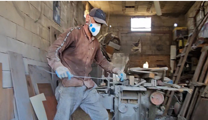
بوادر حياة جديدة في الطبية

متكاملة، ويعتقد أن «عودة الأهالي إلى البلدة وفتح المصالح يعيدان الحياة للطبية ولساحتها التراثية».