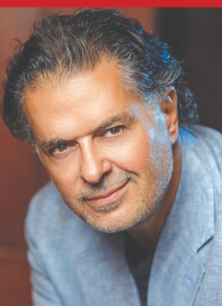
الفنان راغب علامة

من القصف الإسرائيلي المتكرّر على مناطق لبنانية.