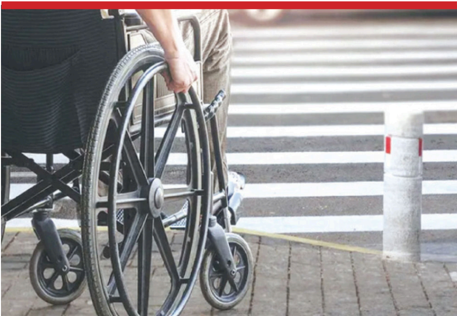
دوو الاحتياجات الخاصة يملكون الكثير من نقاط القوة

الزراعة، الطهو، الضيافة وتصميم الجرافيك وغيرها. إضافة إلى محاولة تأمين عمل لهم بعد تخرجهم.