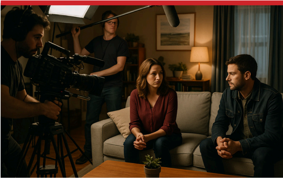
المبادرة انطلقت من تحليل موضوعي للواقع الدرامي

يُذكر أنّ «قانون تنظيم البث الإذاعي والتلفزيوني» يُلزم القنوات اللبنانيّة ببثّ عدد من الساعات الدراميّة سنويًّا، إلّا أنّ هذا البند ظلّ حيزًا على ورق باعتبار أنّ أزمات البلد وأوضاعه الاقتصادية حالت دون إمكان تحقّل إدارات هذه القنوات كلفة إنتاج أعمال درامية أو شراء مسلسلات تنتجها شركات خاصة.