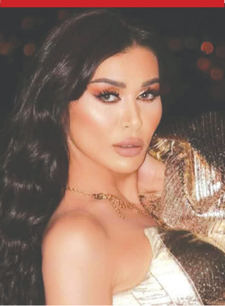
الممثلة نادين الراسي