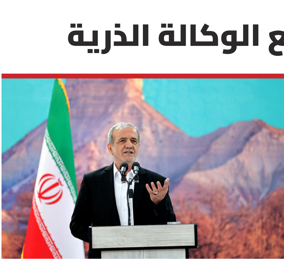
وضعت طهران شروطًا قبل استئناف تعاونها مع الوكالة

في المقابل، اعتبرت الخارجية الأميركية أنّه من غير المقبول أن تقرّر طهران تعليق تعاونها مع الوكالة الذرية، مطالبة إيران بالتعاون الكامل مع الوكالة من دون أي تأخير. ودعا وزير الخارجية الإسرائيلي جلعون ساعر، المجتمع الدولي، إلى «التحرّك بحزم»