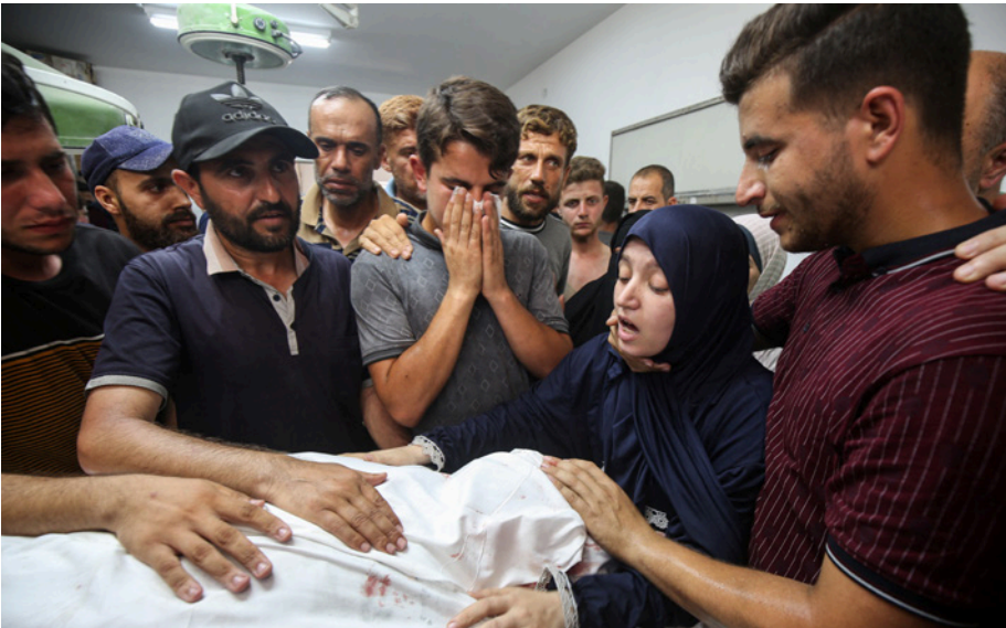
شبح الموت لا يُفارق الغزيين

إلى ذلك، وافق أعضاء مجلس العموم البريطاني على حظر حركة «فلسطين أكشن» المناصرة للفلسطينيين باعتبارها «منظمة إرهابية». بعدما اتّقدم ناشطون فيها قاعدة عسكرية وألقوا أضرارًا بطائراتين احتجّادًا على ما تصفه الحركة بدعم بريطانيا لإسرائيل.