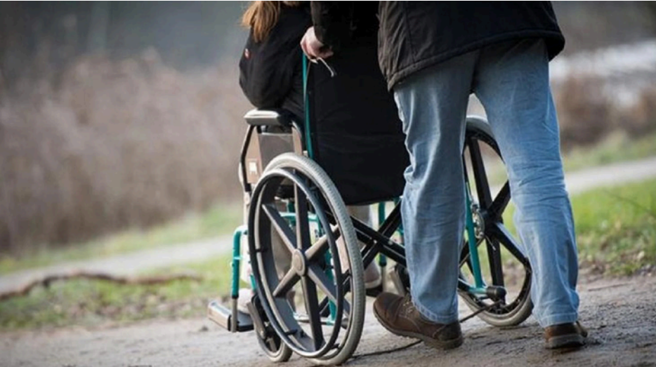
يد واحدة لا تصفق وبالتعاون قوة