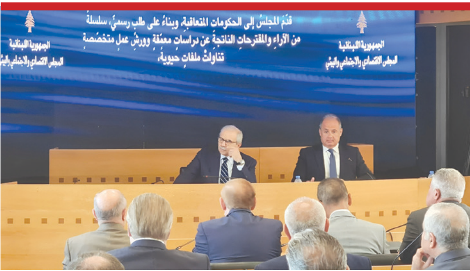
سلام في المجلس الاقتصادي والاجتماعي والبيئي

المتحدة على تنفيذ مشاريع تفوق قيمتها 350 مليون دولار في الجنوب، تغطي قطاعات التعليم، والصحة، والماوى، والأمن الغذائي، ضمن خطة دعم تمتد لأربع سنوات. وتؤمن أن مشروع إعادة الإعمار لا يكتمل من دون دعم أشقائنا العرب. من هنا، نتطلع إلى مساهمة فاعلة تُعيد بناء ما تذر، وتُعزّز قدرة لبنان على النهوض. كما نعمل بالتوازي على التحضير لمؤتمر دولي لإعادة الإعمار، من المتوقع عقده خلال الأشهر المقبلة، ليكون محطة جامعة لتكثيف الدعم وتنسيق الجهود تحت قيادة الدولة اللبنانية ووفق أولويات واضحة».