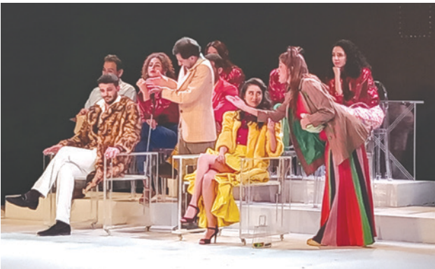
مشهد من المسرحية

افتُتحت مساء الثلاثاء على «مسرح المونو» في الأشرفيّة، عروض مسرحيّة «شغلّة فِكِر»، من كتابة وإخراج غبريال بكيّين ومن بطولة طلال الجدي وطارق تميم وعدد من الممثلات والممثلين الشباب.