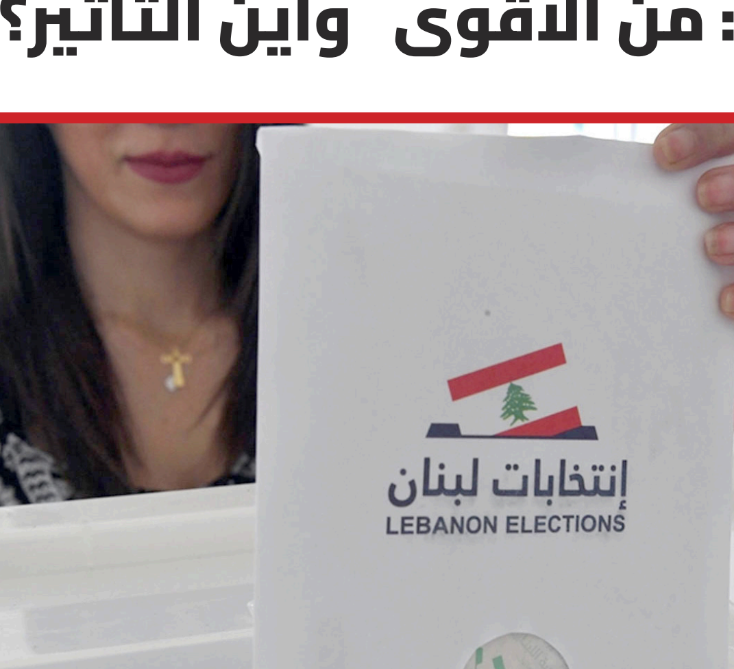
يجلعه عمليًا متأثرًا بأصوات طوائف أخرى، وبالتالي لا تعود العدالة قائمة، لا للمقعد ولا للطائفة».

موازين انتخابات 2026، فالتفاوت بين القارات، وبين الدول، ودخل الدوائر الانتخابية نفسها، يضع مبدأ المساواة بين الناخبين أمام اختبار فعلي، سواء أقيبع الدائرة 16 أم ألغيت.