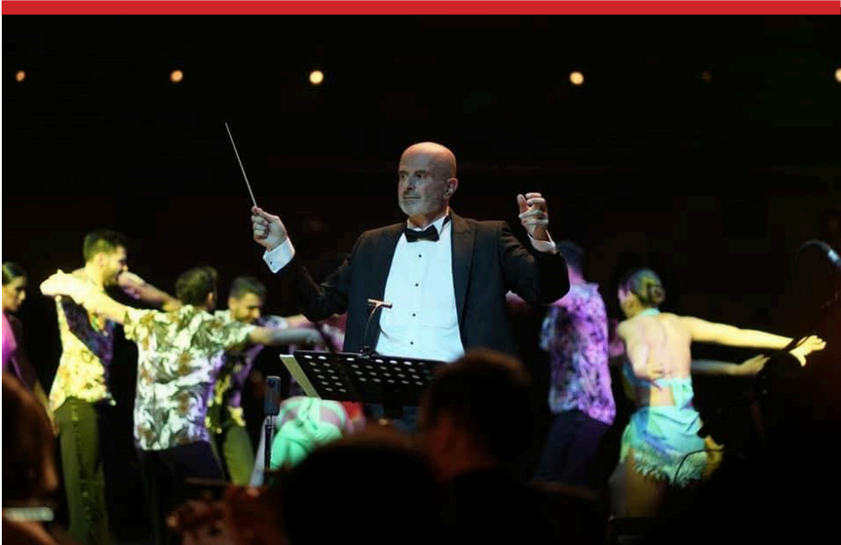
طوني مخول في أحد عروضه

في رؤيته الفنية، مشدداً على أن «الأصالة هي التي تبقى، وكلّ تطور حقيقي ينبغي أن يخدم الهوية لا أن يذيبها». مخول من مئة مشارك بين موسيقيّين محترفين، ومغنين منفردين، وكورال، وراقصين، إضافة إلى فريق تقنيّ يعمل خلف الكواليس، ضمن تصميم بصريّ ومسرحيّ دقيق». ويوضح أن التحضيرات «تشبه إدارة مشروع متكامل، حيث تجرى بروفات يوميةً مع تنظيم تقنيّ دقيق لضمان السجام والعناصر الموسيقية والكوريغرافية والإضاءة والمؤثرات البصريّة والإخراج في صورة واحدة متماسكة». ويعتبر مخول أن «وقوف عدد من الفنانين على مسرح واحد في لبنان هو في حدّ ذاته رسالة حياة تؤكد أن الإبداع قادر على الاستمرار رغم كل الظروف».