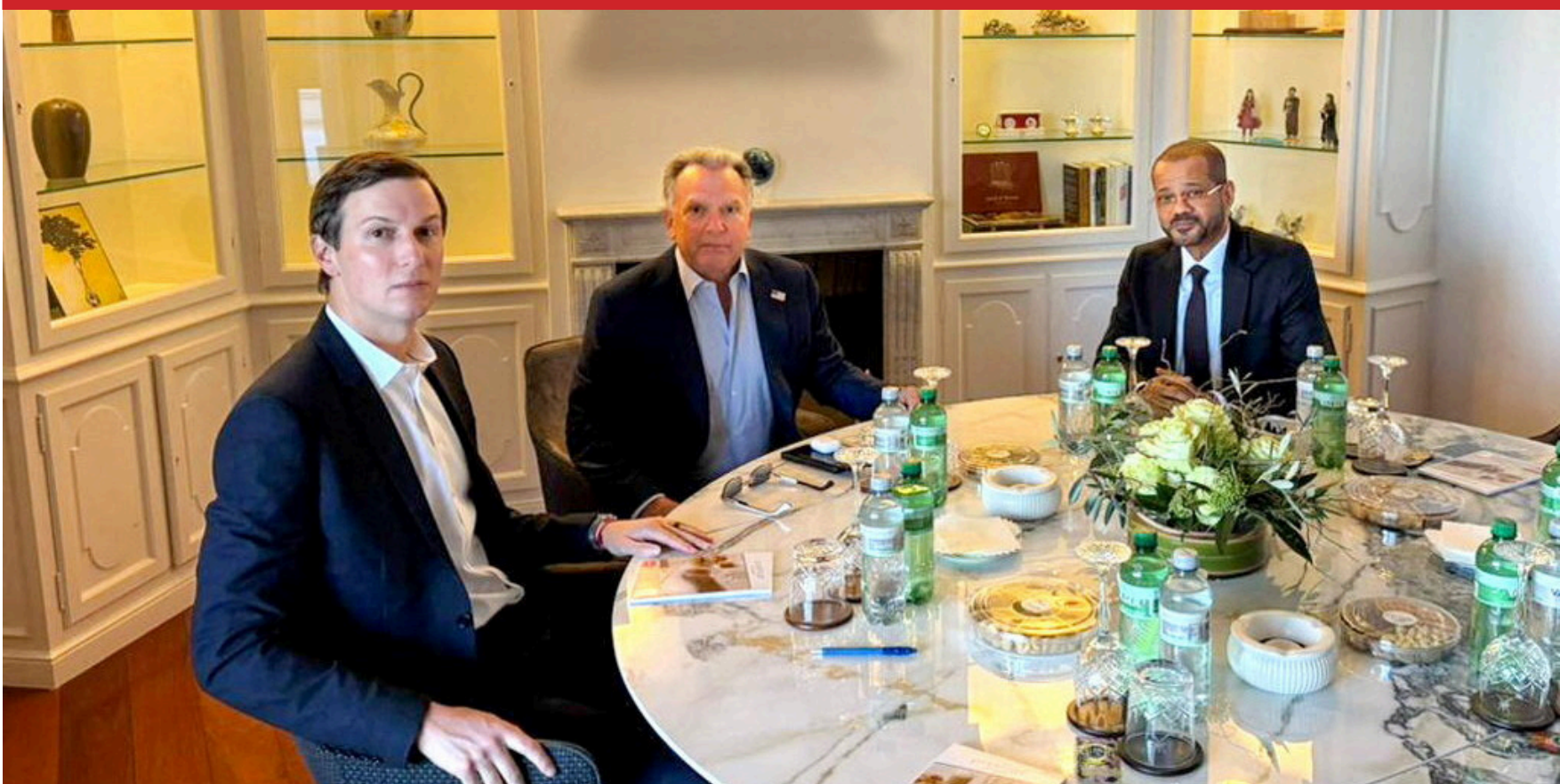
البوسعيدي وويتكوف وكوشنر في جنيف أمس