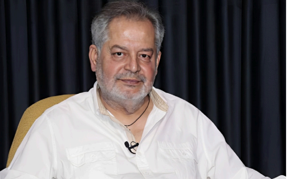
الممثل أسعد رشدان

الأساعي». أما صباح الخميس، وقبيل التّمول للتحقيق، فنشر رشدان على حساباته في مواقع التواصل، مقابلة جديدة أجريت معه أكد خلالها أن تصريحه السابق تُشير بشكل مجتزأ، حيث جرى انتقاء مقاطع محدّدة وإخراجها من سياقها الطبيعي، ما أدى إلى تضخيم ردود الفعل ضده على منصات التواصل.