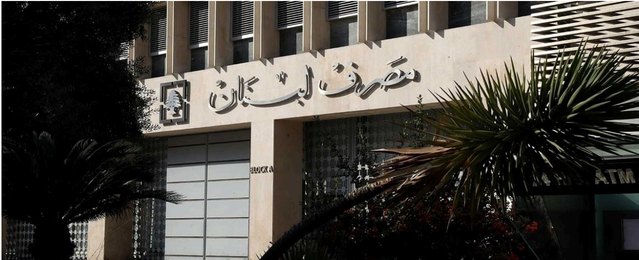
تثبيت قضائي للحصانة السيادية

يرحب مصرف لبنان بهذه القرارات التي تدعم المبادئ الجوهرية للسيادة القانونية والاستقرار التشريعي والانضباط القضائي ويجدد المصرف التزامه الراسخ بأداء مهامه وفق صلاحياته القانونية وبما يتوافق مع المعايير الدولية المعتمدة».