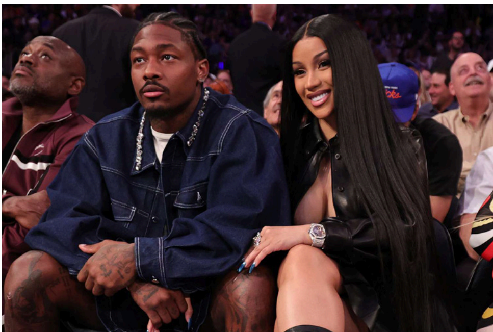
كاردي بي وستيفون ديفز

كاردي بي وستيفون ديفز انفصلا هذا العام قبل مباراة «السيوربول»، وأشارت إلى أن العلاقة بينهما أصبحت معقدة. وجرى تداول معلومات صحافية أن المغنية