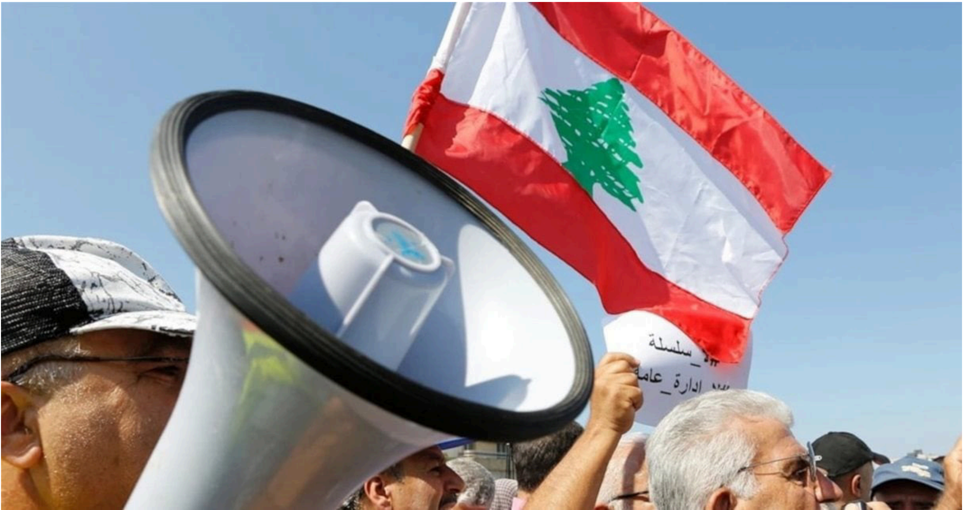
واقع عمالي كارثي وتراجع غير مسبوق في القطاعات

في الدّول من أيار، الذي يُصادف عيد العمال العالمي، يحلّ هذا الاستحقاق هذا العام على لبنان في ظل ظروف اقتصادية واجتماعية ومعيشية تُعدّ من الأصب منذ سنوات، حيث تواجه الطبقة العاملة تحديات غير مسبوقة نتيجة الأزمات المتراكمة والانهيarts المتتالية التي أصابت مختلف القطاعات الإنتاجية والخدماتية.