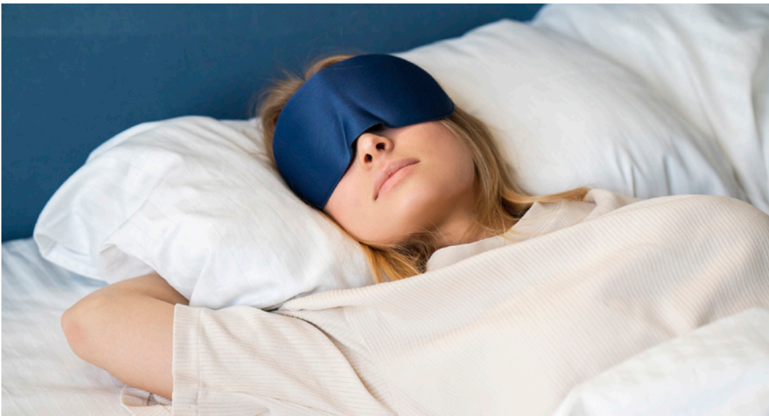
هناك حلول طبيعية بعيداً من الأدوية

يعاني ملايين الأشخاص حول العالم من صعوبة النوم أو الاستيقاظ المتكرر خلال الليل، ما يدفع الكثيرين للبحث عن حلول طبيعية بعيداً من الأدوية.