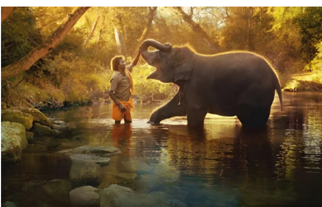
من إنتاجات بوليوود

بهاذا الأمر، على اعتبار أنّ هذه المواقع التصوير. وقال الممثل