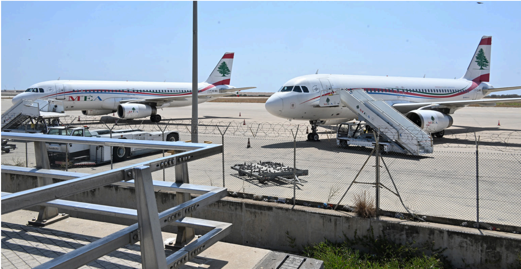
استمرارية النقل الجوي بادرة أمل لشعب يواجه تحديات كبيرة