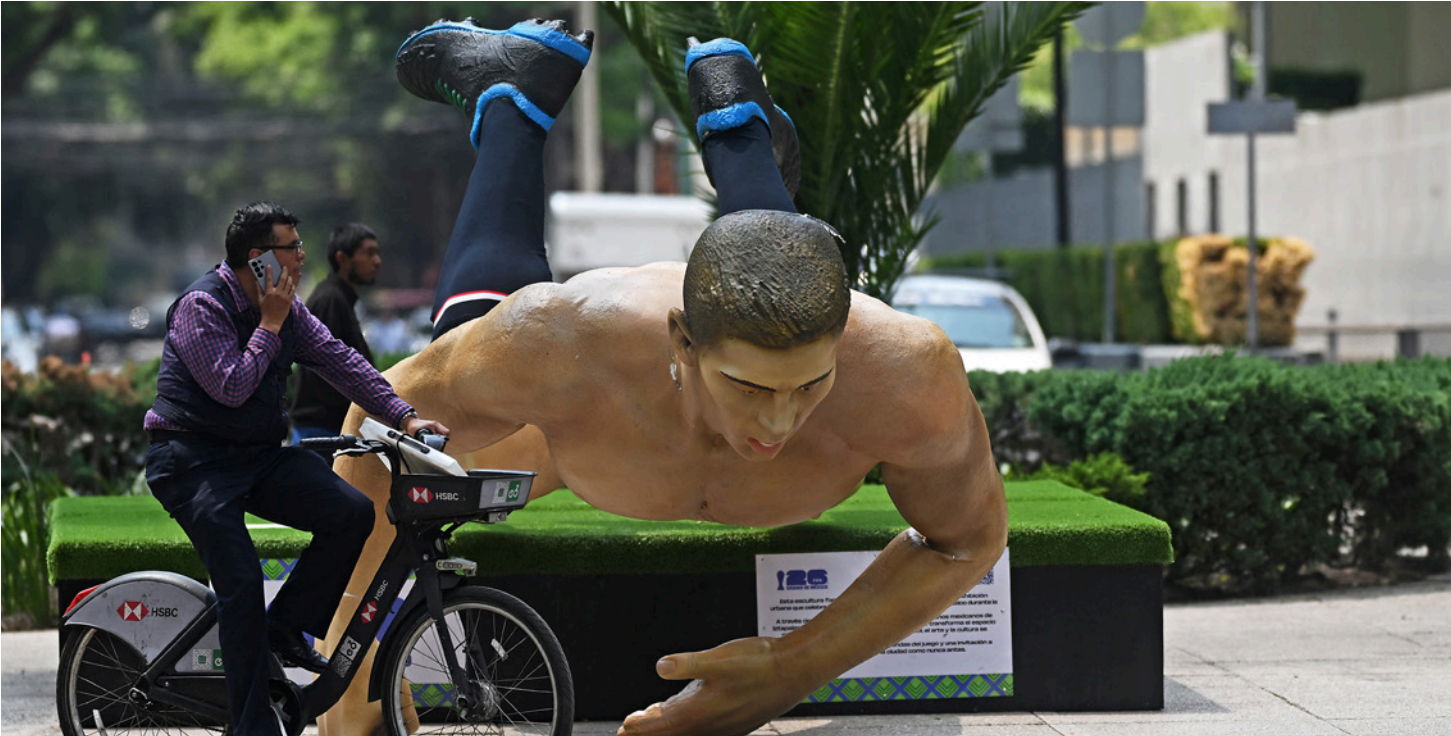
إسقاط تماثيل ضخمة يبلغ ارتفاع بعضها نحو خمسة أمتار

من يدقق في بيان قبلان، يلاحظ استخدامه المفردات نفسها التي يستعملها أخوه أبو عبيدة: قتال أسطوري، صمود أسطوري. ملاحم. هذا وأفادنا أبو عبيدة، مشكوراً، بأخر معلومة وفحواها أن «قوى المقاومة جرت العدو الولايات وأبناء لبنان سطرورا الملاحم» وأخشى ما نخشاه أن يتحول جنوبنا، بفضل تسطير الملاحم، صورة طبق الأصل عن غزة. عندها يصح القول إن قبلان وأبا عبيدة وجهان لمحنة واحدة.