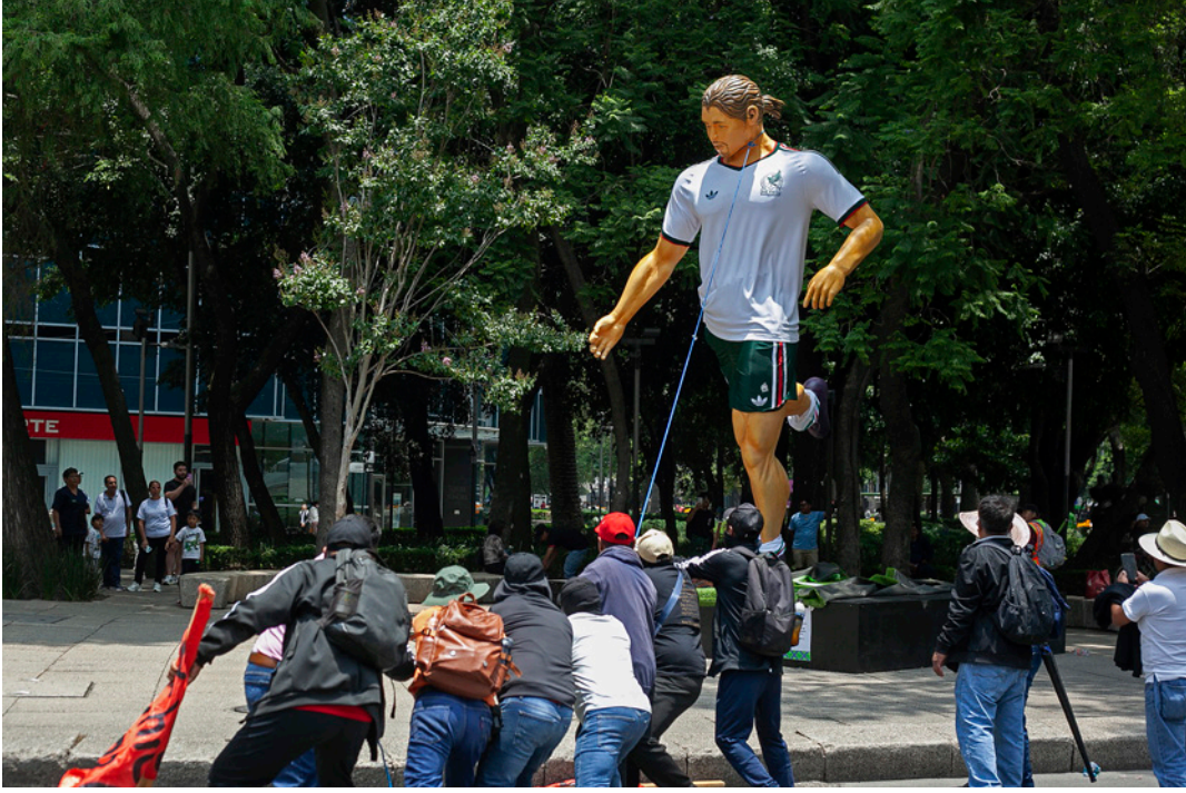
تهديدات بتصعيد أكبر

تشهد العاصمة المكسيكية احتجاجات أعادت الجدل إلى الواجهة حول الأوضاع الاجتماعية والاقتصادية في البلاد، بعدما استهدف معلمون مضربون فعاليات ترويجية خاصة ببطولة كأس العالم 2026، وأسقطوا تماثيل عملاقة للاعب كرة القدم وأحرقوها في الشوارع.