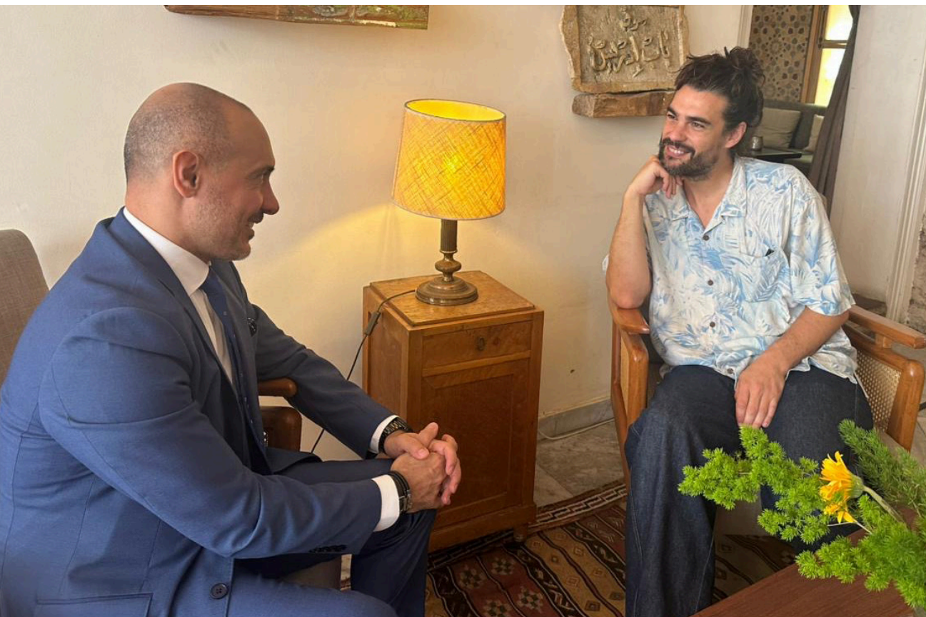
أوليفر لاشه خلال الحوار مع «نداء الوطن»

جلس أوليفر لاشه (Oliver Laxe) في أحد مقاهي شارع مار مخايل، كأنه خارج للتوّ من أحد أفلامه. قامته الطويلة، متران تقريبًا، تفرض حضوره فورًا، لكن الهدوء الذي يحيط به، ولطفه في الحديث، ورّقته في التعامل، سرعان ما تجعلك تنسى هذا التفصيل الشكلي. في هذا اللقاء الخاص مع «نداء الوطن»، لم يتحدّث المخرج والكاتب الإسباني - الفرنسي عن فيلمه الأخير «Sirāt» (صراط) فحسب، بل عن الموت والعبور والخسارة والإيمان، وهي الموضوعات نفسها التي تُشكّل جوهر عالمه السينمائي.