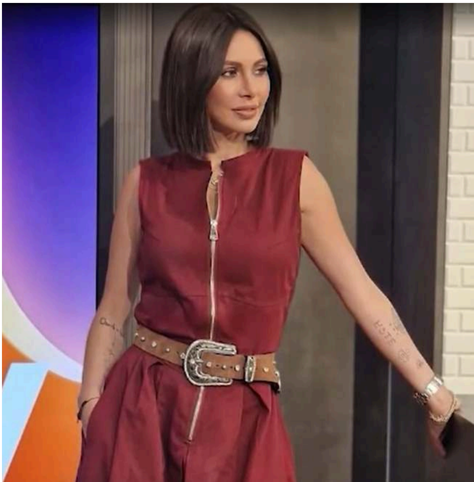
الرائحة بامبلا فنون

خلال حديثنا المطول مع لاشه، يتوقف عند مفهوم الفقدان، بالنسبة إليه، الحياة نفسها ليست سوى سلسلة من الخسارات المتعاقبة، والإنسان يحتاج إلى التدرّب على الفقد كما يتدرّب على أي مهارة أخرى. فعلم الموت، أو بالأحرى تعلّم قبول الموت، هو ما يسمح لنا باستقبال الرحيل