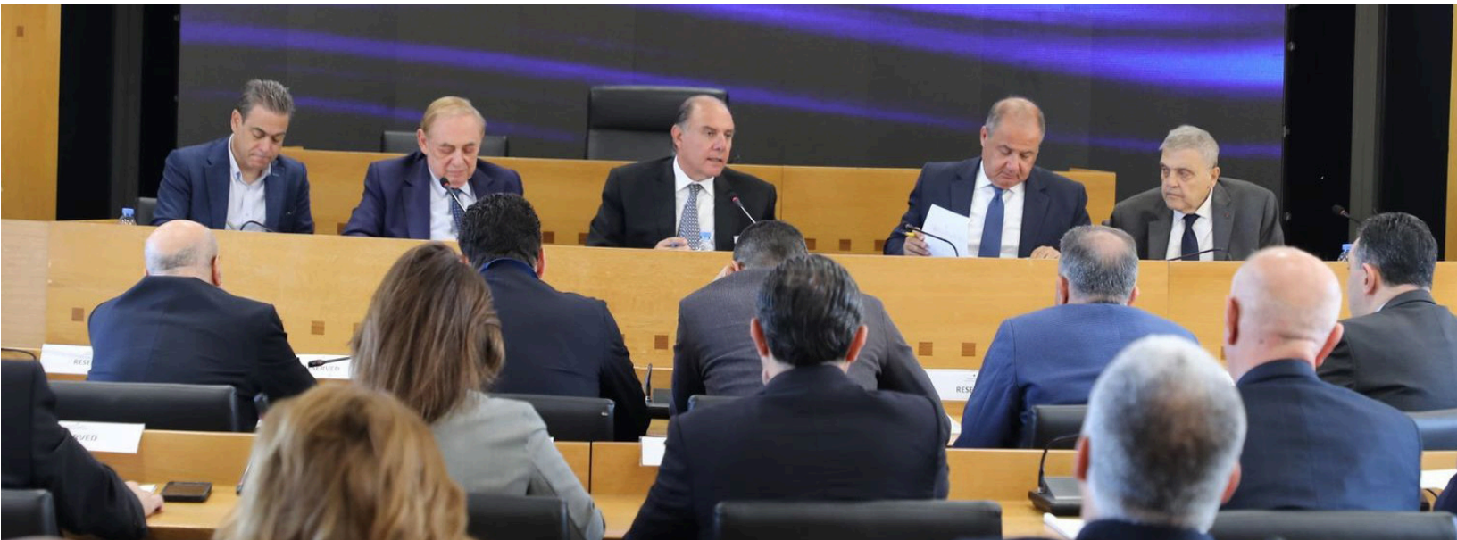
خلال اللقاء الحواري

أكد حاكم مصرف لبنان كريم سعيد إن الأزمة المالية/ المصرفية في لبنان هي، من الناحية التقنية، «أزمة نظامية» بكل ما للكلمة من معنى، وقد جرى توصيفها على هذا النحو من قبل العديد من الخبراء محلياً ودولياً، كما أمّرتّ بها مؤخراً صندوق النقد الدولي.