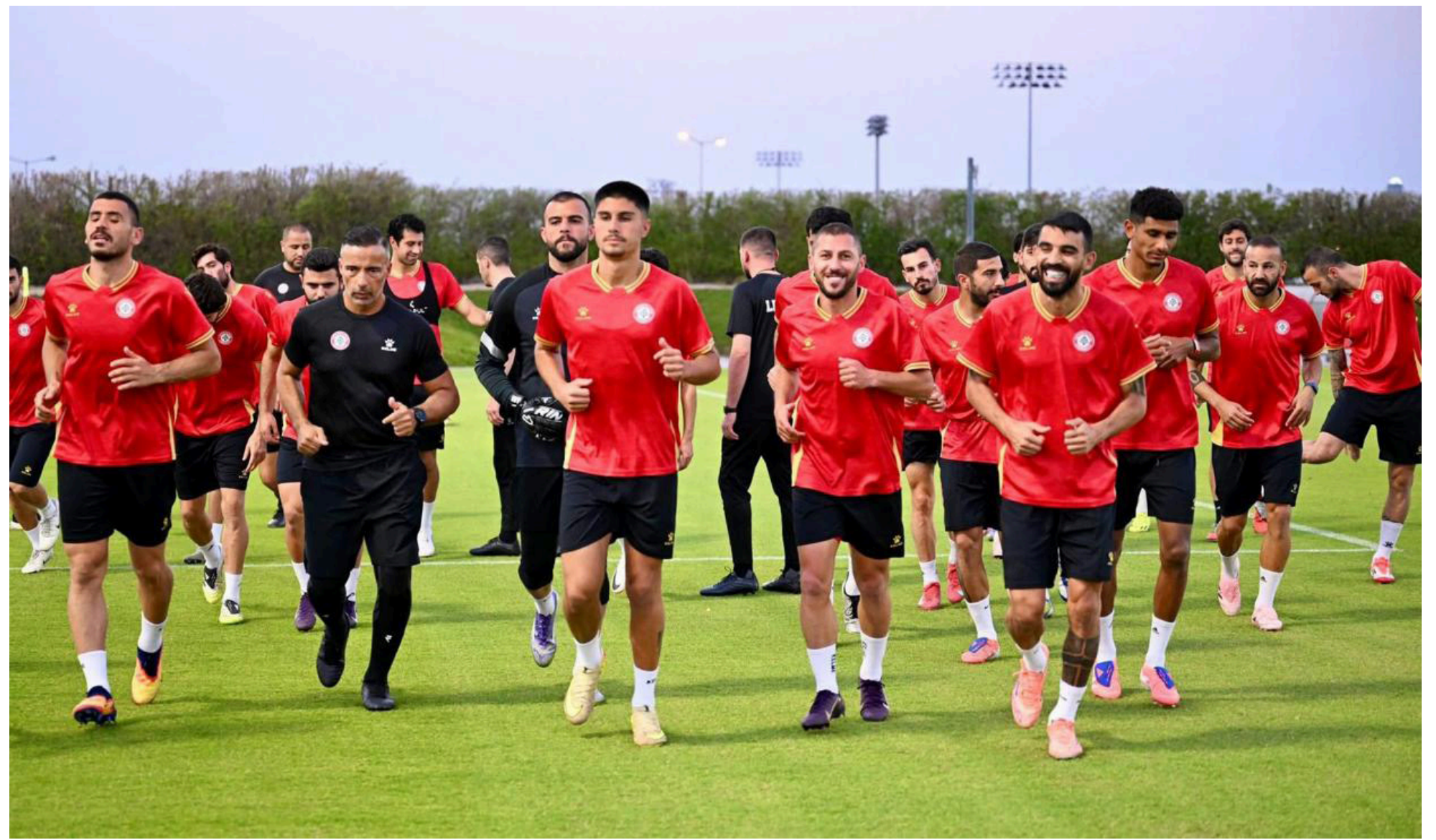
من تدريبات المنتخب اللبناني عشية المباراة المرتقبة أمام اليمن

على امتداد أكثر من تسعة عقود، رسمت كأس العالم خريطة المجد الكروي من خلال مجموعة محدودة من المنتخبات التي نجحت في اعتلاء عرش اللعبة الأكثر شعبية في العالم. فمُنذ تنويع الأوروغواي بأول نسخة عام 1930، شهد المونديال فترات من الهيمنة والتنافس بين القوى الكروية الكبرى، حيث فرضت البرازيل نفسها كأجّح منتخب في تاريخ البطولة بخمسة ألقاب، فيما تقاسمت ألمانيا وإيطاليا المركز الثاني بأربعة تتويجات لكل منهما. كما رسخت الأرجنتين ألقابها، كان آخرها في مونديال قطر 2022، بينما نجحت فرنسا والأوروغواي في التتويج مرتين لكل منهما، وحصدت إنكلترا وإسبانيا لقبًا واحدًا. ولم تكن رحلة التتويج باللقب العالمي سهلة في أي حقبة من الحقبة، إذ ارتبطت كل بطولة بالعقد الأخير. ومع اقتراب كأس العالم 2026، تبقى الخانة الأخيرة في السجل الذهبي مفتوحة، في انتظار المنتخب الذي سيتمكن من إضافة اسمه إلى قائمة الأبطال في مسيرة البطولة الأعلى والأكثر متابعة في العالم. حدث يجمع الشعوب ويصنع