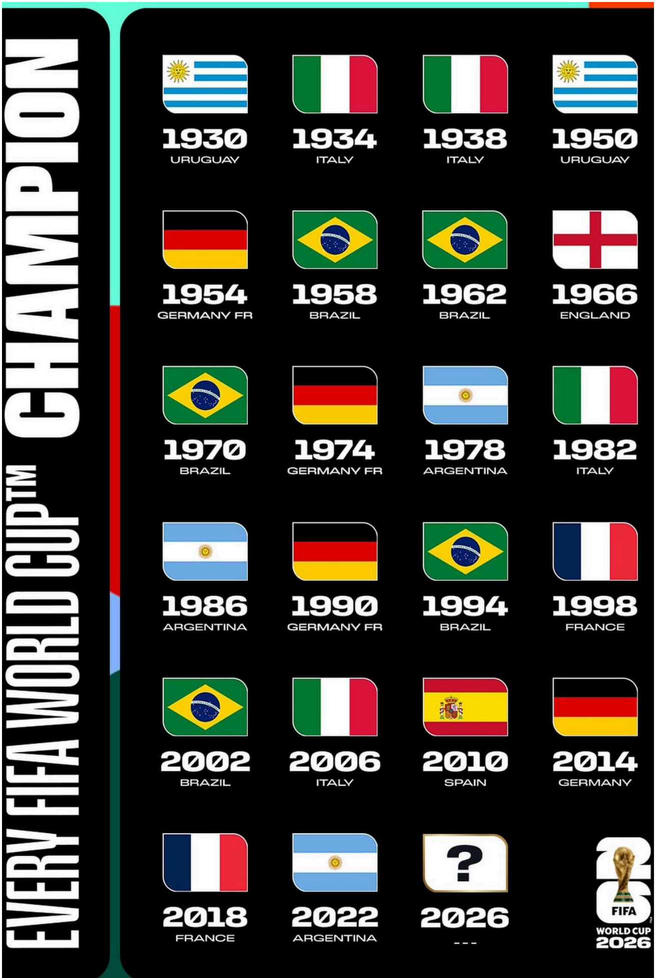
خريطة الهيمنة في كأس العالم