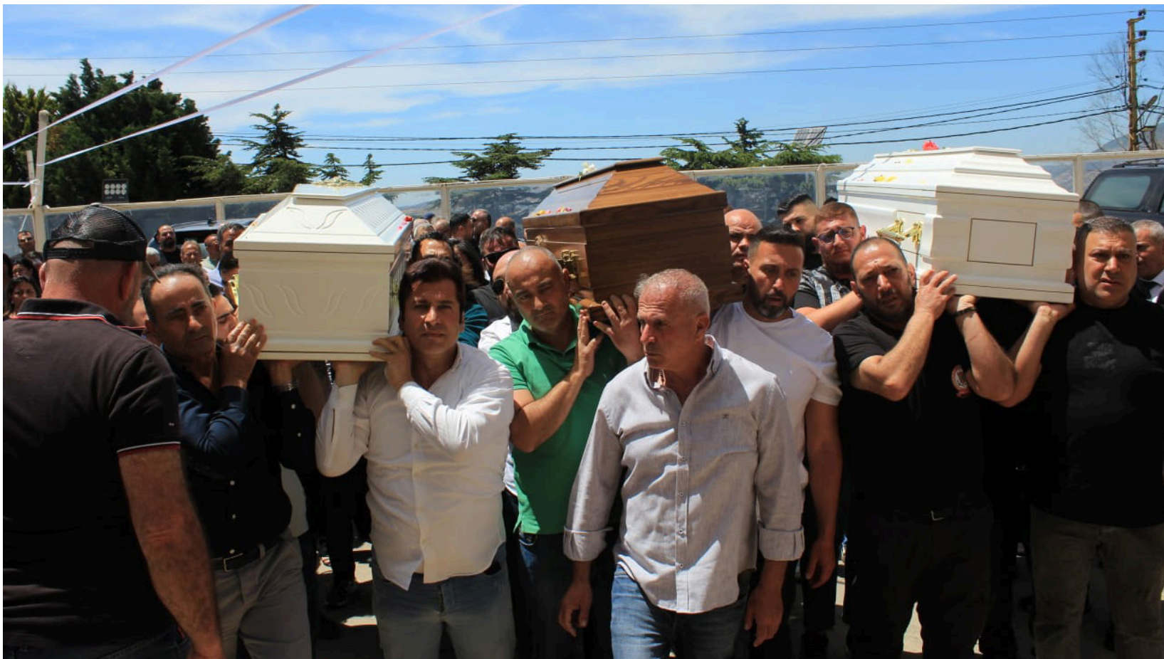
ثلاثة أحلام انتهت على الطريق

الراحل الذي كرس نفسه لخدمة بلده وأهلها، ولم يغادرها يوماً رغم الظروف الصعبة التي مرت بها المنطقة، بل بقي إلى جانب أبناء بلده عاملاً على تأمين احتياجاتهم ومتابعة شؤونهم حتى اللحظات الأخيرة.